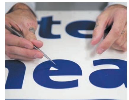
Textos de vinil