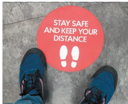
Sticker und Haftfolien