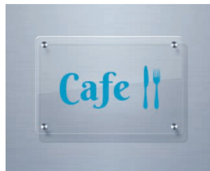
Éléments graphiques rigides