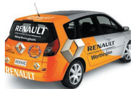
Habillages de véhicules